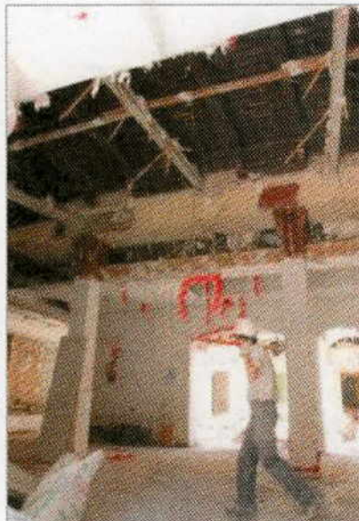
OCULTO. Los artesanados se encontraban tapados por falsos techos de escayola.